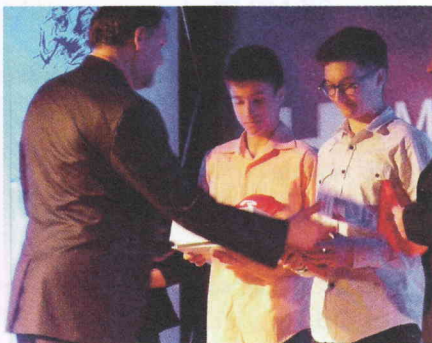
Mladí sportovci si převzali ceny

Nejen sportovci okresu, ale také Hodonín minulý měsíc ocenil největší sportovní hvězdy, tentokrát samotného města. V sobotu 9. března na plese sportovců oceňovali ty nejlepší v devíti kategoriích.