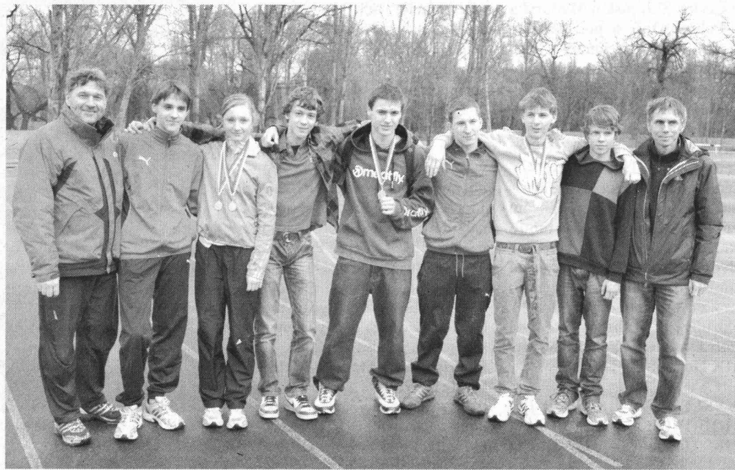
Společná fotka výpravy atletů AK Hodonín z MČR dorostenců a juniorů v hale.